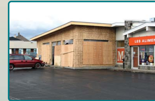
Future boutique Chlorophylle